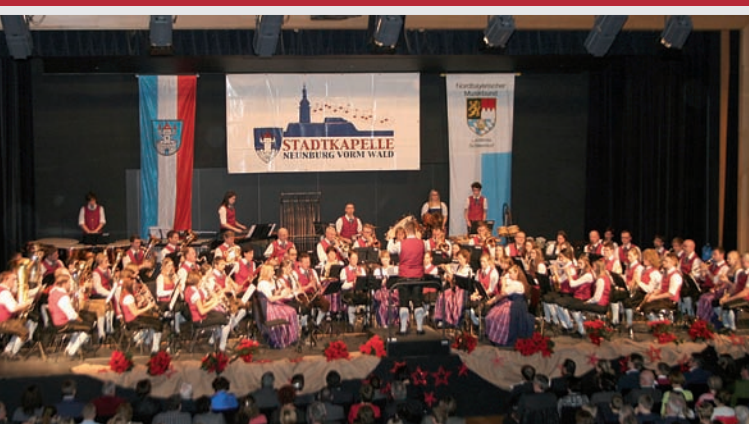
Weihnachtskonzert der Stadtkapelle 25.12.2019

Konzerte | Theater | Tagungen | Firmen- und Familienfeiern