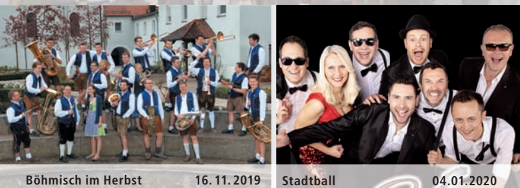
Böhmisch im Herbst 16.11.2019